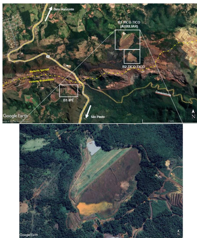
Figura 1. Localização das barragens i) B1 Ipê, na vertente Brumadinho; ii) B2 Tico-Tico, e iii) B1 Auxiliar, ambas na vertente Igarapé. Destaque na barragem B1 Auxiliar, na vertente Igarapé, à leste da BR-381. Coordenadas: 574.430m E / 7.776.830m N. Datum Sirgas 2000.

A Barragem B1 Auxiliar, Mina Tico-Tico, localiza-se no vale do córrego Olaria, no município de Brumadinho-MG, próximo do alto da Serra das Farofas. A estrutura situa-se a jusante da Barragem B2 – Mina Tico-Tico (B2TT) e a montante da estrutura descaracterizada da Barragem B1 Ecológica – Mina Tico-Tico (B1 Tico-Tico). O acesso é realizado pelo trevo imediatamente após o km 520 da rodovia Fernão Dias (BR-381), margem direita no sentido sul (BH-SP). Na Figura 1 é apresentada a localização da barragem.