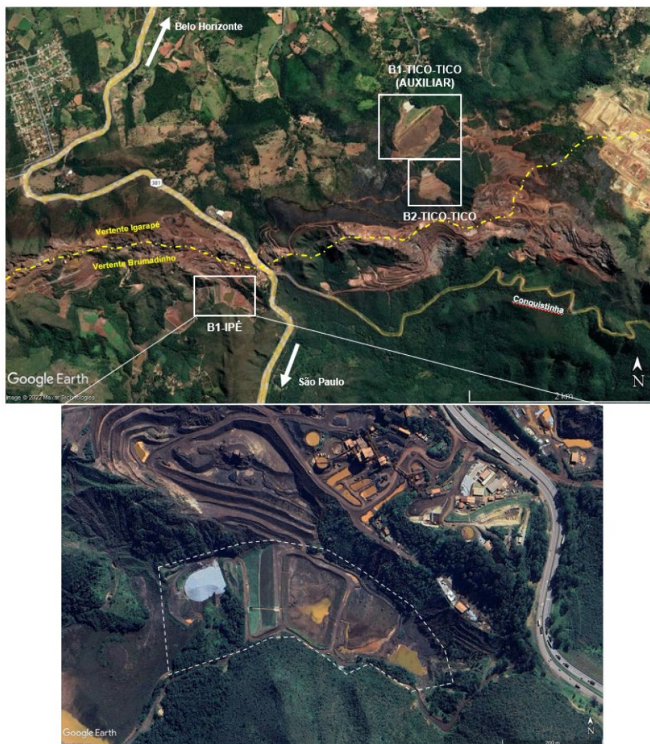
Figura 1. Localização das barragens i) B1 - Mina Ipê, na vertente Brumadinho; ii) B2 Tico-Tico, e iii) B1 Auxiliar, ambas na vertente Igarapé. Destaque na barragem B1 - Mina Ipê, na vertente Brumadinho, à oeste da BR-381 (canto direito da imagem inferior). Coordenadas: 572.390m E / 7.775.120m N. Datum Sirgas 2000.

A Barragem B1 – Mina Ipê localiza-se no vale do córrego Olaria, no município de Brumadinho-MG, próximo do alto da Serra das Farofas. O acesso é realizado pelo trevo imediatamente após o km 520 da rodovia Fernão Dias (BR-381), margem direita no sentido sul (BH-SP). Na Figura 1 é apresentada a localização da barragem.