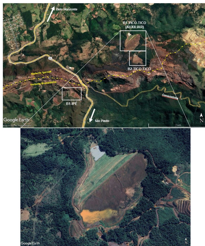
Figura 1. Localização das barragens i) B1 Ipê, na vertente Brumadinho; ii) B2 Tico-Tico, e iii) B1 - Auxiliar, ambas na vertente Igarapé. Destaque na barragem B1 - Auxiliar, na vertente Igarapé, à leste da BR-381. Coordenadas: 574.430m E / 7.776.830m N. Datum Sirgas 2000.

A Barragem B1 - Auxiliar, Mina Tico-Tico, localiza-se no vale do córrego Olaria, no município de Brumadinho-MG, próximo do alto da Serra das Farofas. A estrutura situa-se a jusante da Barragem B2 – Mina Tico-Tico (B2TT) e a montante da estrutura descaracterizada da Barragem B1 Ecológica – Mina Tico-Tico (B1 Tico-Tico). O acesso é realizado pelo trevo imediatamente após o km 520 da rodovia Fernão Dias (BR-381), margem direita no sentido sul (BH-SP). Na Figura 1 é apresentada a localização da barragem.