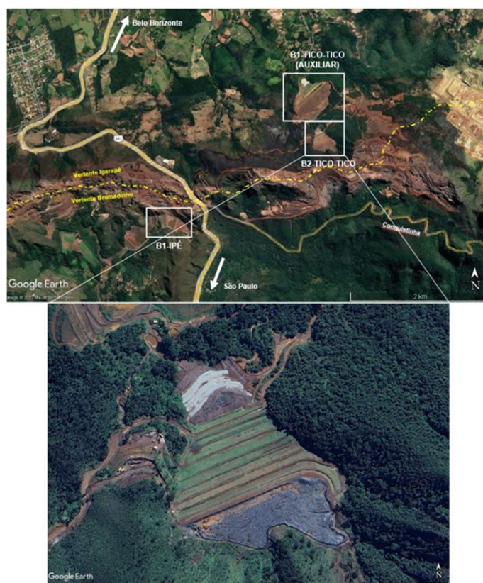
Figura 1. Localização das barragens i) B1 Ipê, na vertente Brumadinho; ii) B2 Tico-Tico, e iii) B1 Auxiliar, ambas na vertente Igarapé. Destaque na barragem B2 Tico-Tico, na vertente Igarapé, à leste da BR-381. Coordenadas: 574.570m E / 7.776.150m N. Datum Sirgas 2000.

A Barragem B2 – Mina Tico-Tico localiza-se no vale do córrego Olaria, município de Igarapé-MG, a montante da estrutura descaracterizada da Barragem B1 Ecológica - Mina Tico-Tico e da Barragem B1 Auxiliar - Mina Tico-Tico. O acesso é realizado pelo trevo imediatamente após o km 520 da rodovia Fernão Dias (BR-381), margem direita no sentido sul (BH-SP). Na Figura 1 é apresentada a localização da barragem.